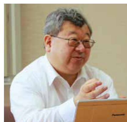
東京工科大学八王子キャンパス 事務局 業務課