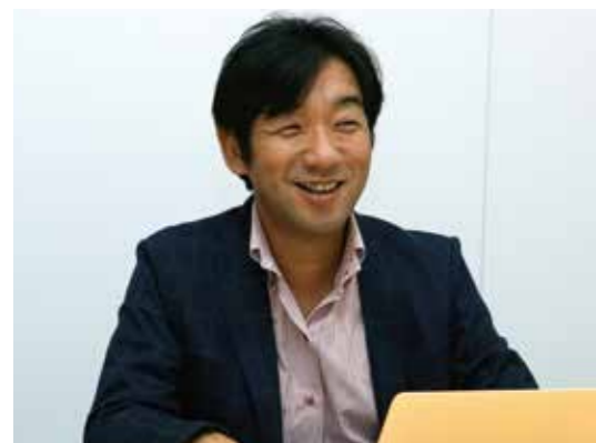
株式会社小学館デジタル事業局Webメディア推進室課長 兼 デジタルメディア室室長

制作会社を途中で変更したこともあり、システムの全体像が見えなくなってしまい、WordPressのパフォーマンスの改善方法や細かいレベルでの問題もよく見えない状態になっていました。そのような時に見つけたのがプライム・ストラテジーの「KUSANAGI」でした。