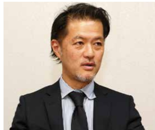
株式会社主婦と生活社 販売本部 マーケティング事業部 部長