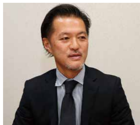
株式会社主婦と生活社 販売本部 マーケティング事業部 部長

「暮らしとおしゃれの編集室」は、プライム・ストラテジーに最初から技術支援を頂いていたので、Webサイトのパフォーマンスや障害など、技術的な部分での問題は全く起こってません。国内トップクラスの技術力を持つプライム・ストラテジーには制作会社が持たない優れた技術があることを痛感しました。今後も「KUSANAGI」+「KUSANAGI公式サポートサービス」での運営を考えていきたいです。