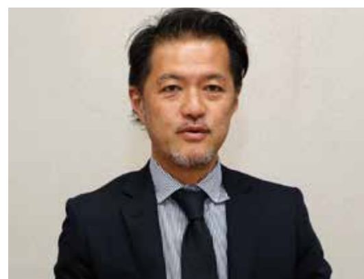
株式会社主婦と生活社 販売本部 マーケティング事業部 部長